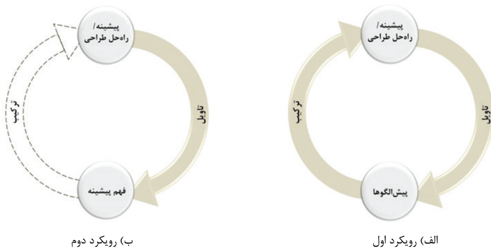
شکل ۱. مقایسه دو رویکرد بهره‌گیری از پیشینه‌ها در طراحی معماری

با یک نگاه کلی به مطالعاتی که در زمینه کاربرد پیشینه‌ها در طراحی انجام شده، سه مرحله اصلی قابل تشخیص است: انتخاب نوع پیشینه‌ها، دستیابی به دانش مستتر در پیشینه‌ها و در نهایت کاربرد آن دانش در فرایند طراحی. در میان این سه، به نظر می‌رسد مهم‌ترین مرحله، مرحله دوم، یعنی دستیابی به دانش مستتر در پیشینه‌ها، باشد؛ بدین دلیل که مقدمه کاربرد صحیح پیشینه‌ها در طراحی است و چنانچه به‌درستی انجام نپذیرد، به برداشت‌های سطحی و تقلیدی از پیشینه‌ها منجر خواهد شد. در پژوهش‌های مختلف گاهی از این مرحله به استخراج دانش کاربردی (ذاکری، ۱۳۹۱، ۱۰۴) و گاهی به خواندن نمونه (علی‌پور، ۱۳۹۶) تعبیر شده است. نکته مهم آن است که در این مرحله، فهم پیشینه اتفاق می‌افتد و بنابراین می‌توان بیان