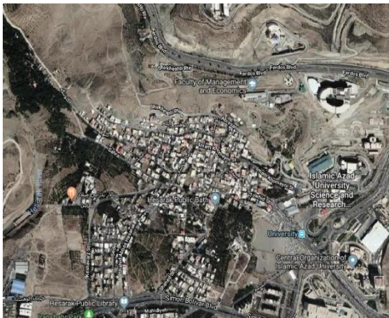
تصویر ۱- عکس هوایی محله حصارک تهران در سال ۱۳۹۸