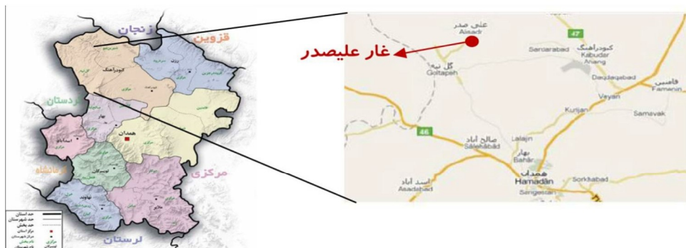
شکل ۱: موقعیت جغرافیایی غار علیصدر

امکان دسترسی به غار علیصدر از چهار مسیر فراهم است: مسیر یک: جاده همدان - بیجار، بعد از گل‌تپه در جاده فرعی سراب - علیصدر، طول مسیر ۷۵ کیلومتر از شهر همدان؛ مسیر دو: جاده همدان - کرمانشاه، صالح آباد، بخش گل‌تپه، ادامه تا غار علیصدر، طول مسیر ۸۰ کیلومتر از شهر همدان؛ مسیر سه: جاده همدان - رزن، تقاطع سهرامی پایگاه هوایی نوژه، ورود به جاده کبودرآهنگ، گل‌تپه تا غار علیصدر، طول مسیر ۱۱۰ کیلومتر از شهر همدان؛ مسیر چهار: از طریق جاده زنجان، قیدار تا غار علیصدر؛ در شکل ۱ موقعیت جغرافیایی غار علیصدر نمایش داده شده است.