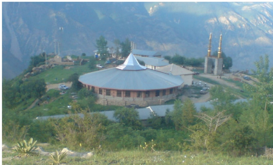
شکل (۳) : امام زاده عبدالمناف و عبدالمطلب(ع)