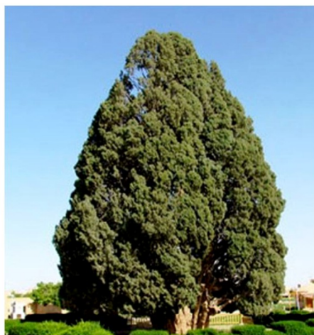
تصویر شماره ۱: سرو اول ابرکوه

سرو ابرکوه گرچه کهنسال‌ترین موجود زنده دنیاست و طول عمر آن حداقل ۴۵۰۰ سال است، قطر تنه بیش از ۳ متر و قطر تاج بیش از ۱۴ متر می‌باشد. ارتفاع این سرو ۲۵ متر است، تصویر شماره (۱) سرو اول را نشان می‌دهد.