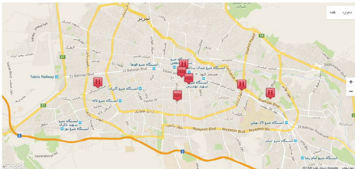
(شکل ۲. موقعیت هتل‌های تبریز)