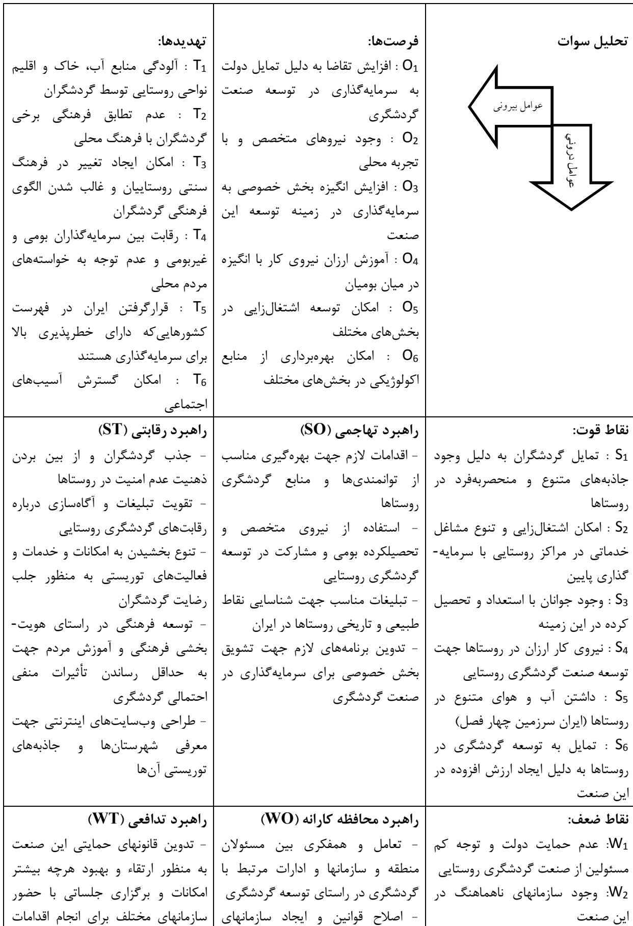
جدول ۹- ماتریس استراتژی‌ها (سوات)