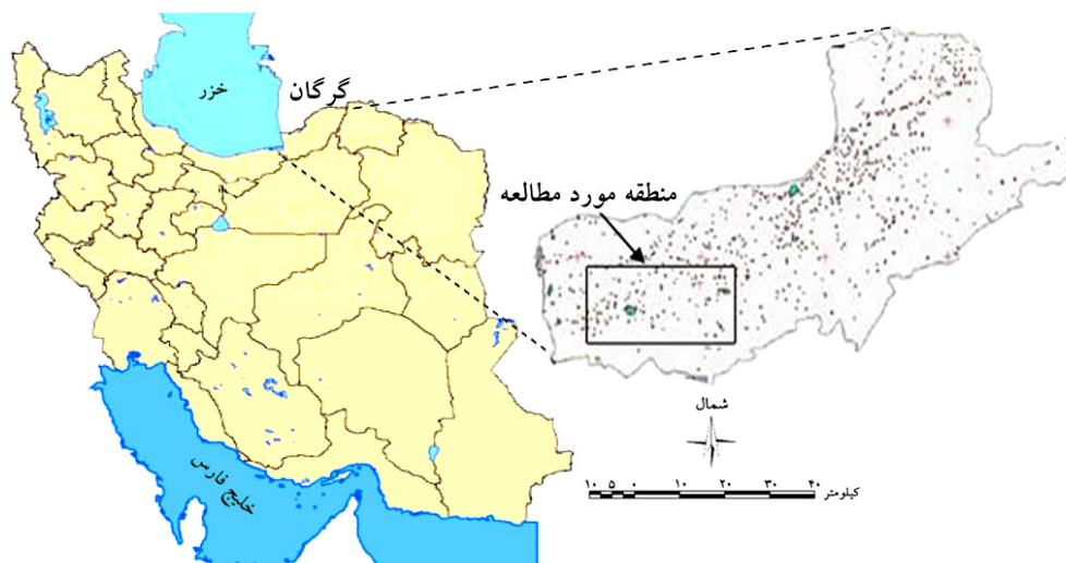
شکل ۱. موقعیت منطقه مورد مطالعه در ایران و استان

شهر گرگان از شهرهای بخش شمالی دامنه ارتفاعات البرز ایران می‌باشد. منطقه تحت پوشش از 54^{\circ}10' تا 54^{\circ}45' طول شرقی و 36^{\circ}44' تا 36^{\circ}58' عرض شمالی با مساحتی حدود ۱۳۱۶ کیلومتر مربع در استان گلستان قرار دارد (شکل ۱).