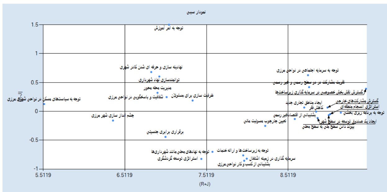
شکل (۲). روابط علی و معلولی بین شاخص‌ها