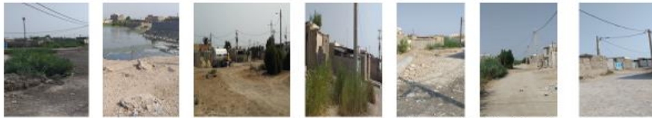
شهرک ولی عصر (گاما) تلمبه خانه شماره ۴ جرف المالح شهرک صباغان (کمپ B) ایستگاه ۷ نيزار دو نيزار یک

شکل ۳- تصویر هفت منطقه حاشیه‌نشین شهر بندر امام خمینی