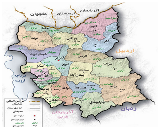
نقشه (۱): موقعیت شهرستان‌های استان آذربایجان شرقی

شده است. مرحله دوم: بی مقیاس سازی؛ برای اینکه کلیه متغیرهای به کار رفته در ستون‌های ماتریس تصمیم‌گیری، به صورت شاخص‌هایی یکسان باشند، به طوری که به راحتی بتوان آنها را با هم مقایسه کرد از بی مقیاس‌سازی نرم (رابطه ۱) استفاده شده و نتایج حاصل از بی مقیاس‌سازی نرم در جدول (۲) ارائه شده است. بر این اساس کلیه ستون‌های ماتریس تصمیم‌گیری، دارای یک واحد طول مشابه‌ای می‌شوند.