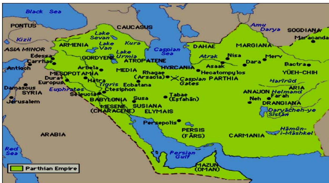
Map:1- Historical geography of the Parthians: height="472" Width="600" Average area: about 5.4 million square kilometers: Historical Site of Mirhadi Hoseini: http://m hosseini.ir

است، اما باید یادآور شد که علاوه بر ارمنستان بزرگ و کوچک، بخشی از گرجستان نیز تابع اشکانیان بود (Mirahmadi, 2013: 94).