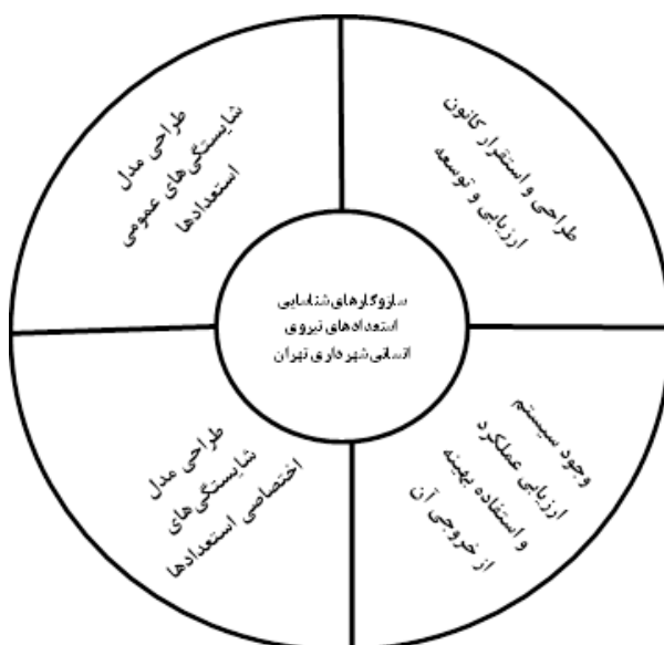
شکل ۲- مدل مفهومی سازوکارهای شناسایی استعداد های نیروی انسانی در شهرداری تهران