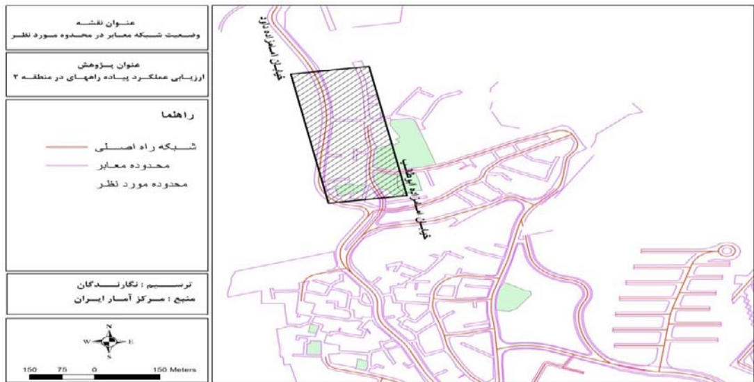
شکل ۱: موقعیت خیابان فرحزاد و راه‌های ارتباطی آن ۲۰۱۵

محدوده فرحزاد، یک محله واقع در شمال غرب تهران و از توابع شمیرانات است که از بزرگراه یادگار امام، جاده فرحزاد و بلوار فرحزادی شهرک غرب قابل آمد و شد است. محله فرحزاد از محله‌های قدیمی شمال شهر تهران است که از گذشته به صورت روستایی در مسیر جاده امامزاده داوود استقرار داشته و به مرور زمان و در اثر توسعه پایتخت به صورت محله‌ای از شهر تهران در آمده است. محله فرحزاد از بخش‌های خوش آب و هوای شمیران به حساب می‌آید که در منطقه ۲ شهرداری تهران واقع شده است. این محله که از محلات قدیمی تهران می‌باشد، به دلیل هوای با طراوت و فرح انگیزش به همین نام معروف شده است. فرحزاد گردشگاه بیلاقی شهروندان تهرانی است که در فصل تابستان به خاطر باغ‌های توت پربارش پذیرای اهالی شهر است. این محدود از ۳ محله تشکیل شده است: محله فرحزاد بالا (شمال اتوبان یادگار امام)، فرحزاد پائین (جنوب اتوبان یادگار امام) و محله امامزاده (صالح). پهنه‌های سکونتی فراغتی و تفریحی که شامل مجموعه‌ای از کاربری‌های تفریحی و تجاری می‌شود. در این محدوده از حیث فعالیت‌های تفریحی و مراودات اجتماعی ناشی از آن در سطح معین مطرح می‌باشند. آنچنانکه شبیه این محدودها در سایر نقاط شهر به دشواری یافت می‌شود. ویژگی‌های طبیعی این محدودها بستر ساز شکل‌گیری این پهنه‌ها بوده است. به گونه‌ای که سازمان زیباسازی شهرداری تهران نیز در طرحی با عنوان «ساماندهی تفرجگاه‌های تهران» که در ۲۹ آبان ۱۳۸۶ کلنگ زنی شده است، در حال محوطه سازی و ساخت باغ تراس در قسمتی از این محله است.