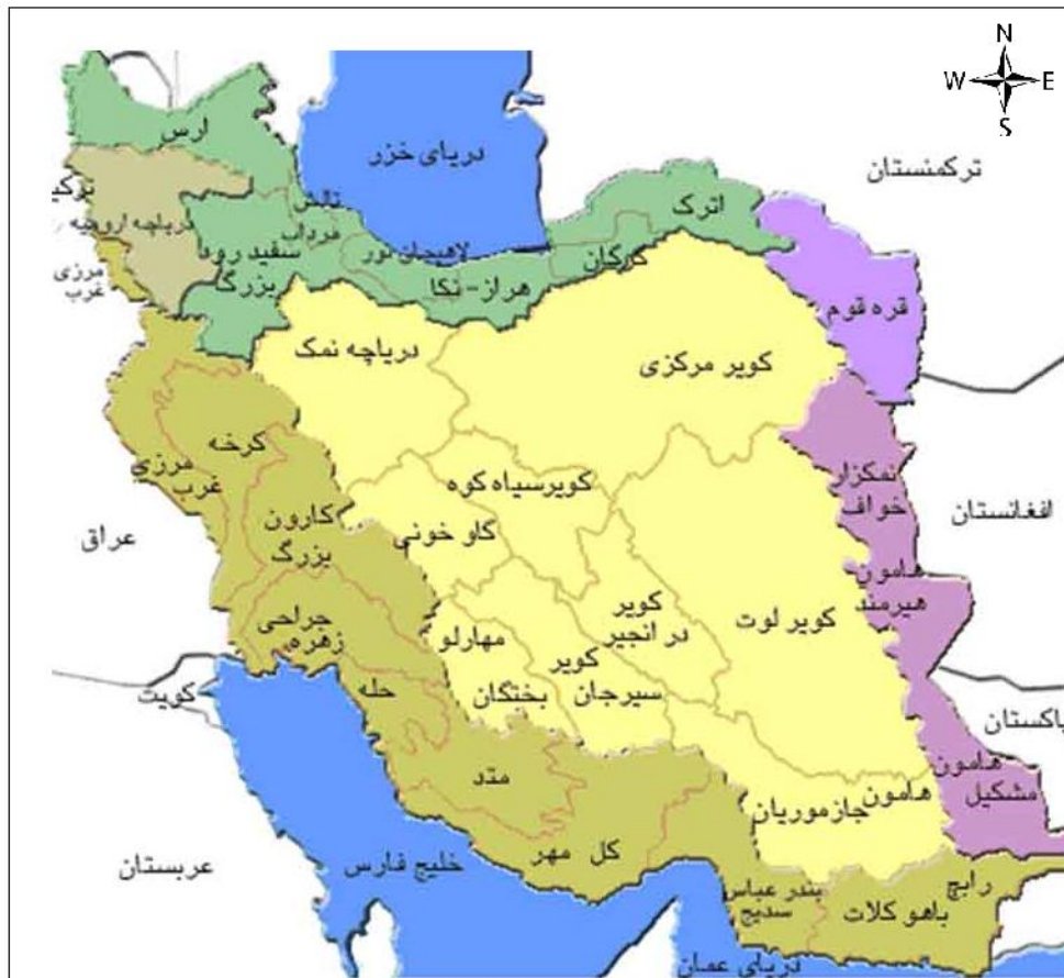
نقشه شماره ۲: حوضه‌های آبریز اصلی ایران

حوضه سرخس وجود دارد (نقشه شماره ۲). در اینجا از بین حوضه‌های مذکور به ویژگی‌های دو حوضه آبریز مرکزی و خلیج فارس و دریای عمان اشاره می‌شود.