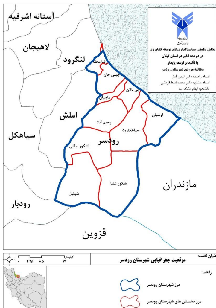
شکل ۲: موقعیت جغرافیایی شهرستان رودسر

آب و هوای نواحی ساحلی و جلگه ای شهرستان رودسر معتدل و مرطوب و مساعد است و آب و هوای مناطق کوهستانی دارای زمستان های سرد و برفی و در تابستان ها نیمه مرطوب و دارای شرایط متعادل است. میزان بارندگی در شهرستان رودسر سالانه ۱۲۰۱ میلی متر و میزان گرما تحت تأثیر عوامل و عناصر گوناگون و به ویژه ارتفاع و عرض جغرافیایی و میزان تابش خورشید از منطقه ای به منطقه ای دیگر تغییراتی را نشان می دهد. در ماه های اردیبهشت و خرداد و تیر، مرداد، شهریور و مهر درجه ی حرارت ماهانه از حد متوسط (۱۶/۵) بیشتر و مابقی ماه های سال درجه ی حرارت از متوسط سالیانه کمتر می باشد. حداقل درجه ی حرارت متوسط ماهانه مربوط به دی و بهمن با ۸/۱ درجه سانتی گراد و حداکثر آن مربوط به تیرماه ۲۵/۷ درجه است. حداکثر بارش در مهرماه به میزان ۲۴۴/۶ میلی متر (۲۰/۴ درصد) بارش سالانه و حداقل بارش در تیرماه به میزان ۳۶/۸ میلی متر (۳/۱ درصد) از بارش سالانه است.