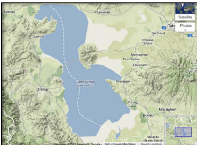
شکل ۱- تصویر ماهواره ای موقعیت جغرافیایی منطقه مورد مطالعه (۲۱ اسفند، سال ۱۳۹۱)