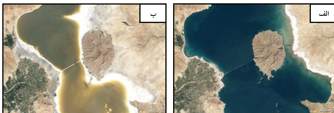
شکل ۳- مقایسه تصویر ماهواره ای لندست دریاچه ارومیه بیانگر خشکی تدریجی (الف- ۳ شهریور ۱۳۷۷ و ب- ۲۲ مرداد ۱۳۹۰)