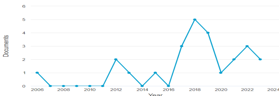
شکل ۱- روند انتشار مقالات مالی عصبی در گذر زمان

هم رخدادی کلمات کلیدی نوعی تحلیل محتوا برای تعیین گرایش‌های موضوعی در حوزه‌های مشخص پژوهشی است. اطلاعات ۴۷ مقاله داندود شده از پایگاه اسکوپوس در اختیار نرم‌افزار وس ویوور ۷ قرار گرفت تا نقشه علم‌سنجی مربوط به آن‌ها ترسیم شود.