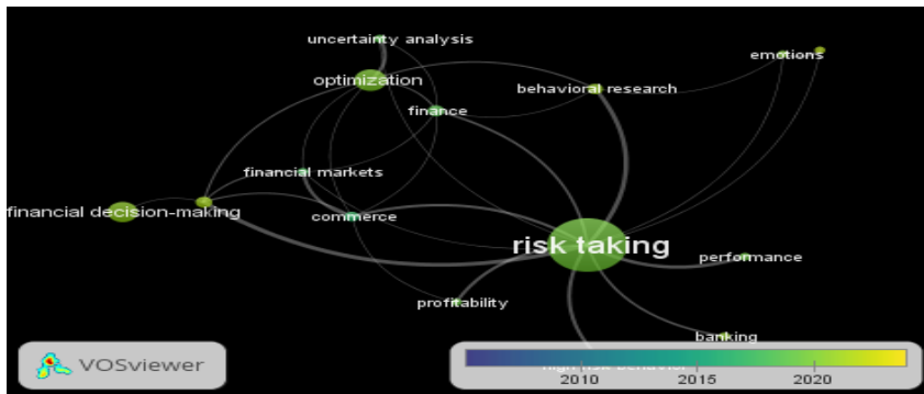
شکل ۲- نقشه هم‌رخدادی کلمات کلیدی در گذر زمان