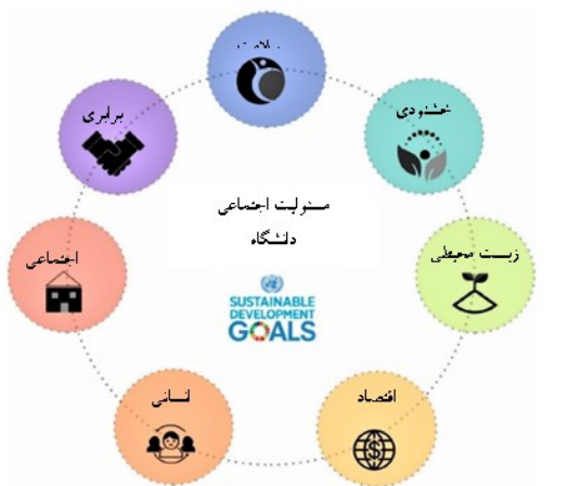
شکل (۱): ساختار مفهومی USR

بیشترین مقاله را دارند، استاونیزر، لو و لانرو هستند. سازنده ترین موسسه دانشگاه ووهان است. ایالات متحده کشوری با بیشترین نشریات و نشست ها و همان کشور همراه با یونایتد است پادشاهی، بیشترین مشارکت بین المللی را داشته باشید. شواهد نشان دهنده افزایش علاقه جهانی به تأثیرات اقتصادی و زیست محیطی USR است. تحقیقات آینده باید بر تحلیل روابط بین مصرف مسئولانه و پایدار دانشگاه‌ها و تأثیرات کوتاه مدت مالی، اقتصادی و پایدار آنها باشد. مدل بررسی شده در تحقیق به شرح زیر می‌باشد: