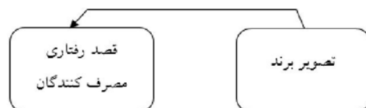
شکل (۳): رابطه بین تصویر برند و قصد رفتاری مصرف‌کنندگان

با توجه به ارتباط بین تصویر برند و قصد رفتاری مصرف‌کنندگان که در شکل ۳ نشان داده شده است، تصویر برند جنبه‌های مهمی از رفتار مصرف‌کنندگان را مورد هدف قرار می‌دهد که به تجربه حاصل از استفاده مصرف‌کنندگان از محصولات و خدمات برند نیز مرتبط است. ویژگی‌های موفق، مثبت و قوی برند بر روی اهداف و ترجیحات خرید مصرف‌کنندگان تأثیر می‌گذارد. به عبارت دیگر، ارزش یک برند را می‌توان در رفتار مصرف‌کنندگان از نظر وفاداری به برند در خرید و ترجیحات برند مشخص کرد. تصویر برند اطلاعات مفیدی در مورد ویژگی‌ها و خصوصیات برند به مصرف‌کنندگان ارائه می‌دهند و سازمانها نیز می‌توانند از بازخوردهای مصرف‌کنندگان در استراتژی‌های آتی ارتباطات بازاریابی مرتبط با برند استفاده کنند (۹).