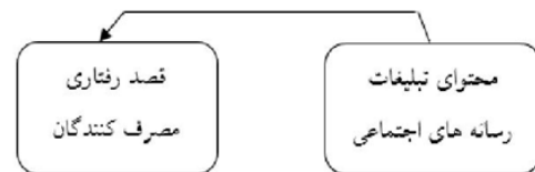
شکل (۲): رابطه بین محتوای تبلیغات رسانه‌های اجتماعی و قصد رفتاری

مثبت مصرف‌کنندگان به برند ناشی از ارزیابی ارتباطات موثر برند مبتنی بر مصرف‌کنندگان است. محتوای تبلیغات رسانه‌های اجتماعی ابزاری قدرتمند، جهت شکل دادن به درک مصرف‌کنندگان و تسخیر برند در ذهن و خاطر آنها است. هنگام خرید کردن یا فکر کردن در مورد انواع مختلف محصولات و خدمات برند، محتوای تبلیغات می‌تواند به مصرف‌کنندگان در شناسایی و تداعی برند به مصرف‌کنندگان یاری رساند (۴).