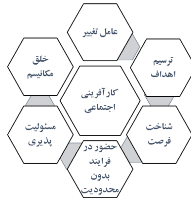
شکل ۲: ابعاد کارآفرینی اجتماعی بر اساس تئوری فردی -

معلولیت xvii ، محرومیت و وضعیت نامناسب یک فرد که پیامد نقص و ناتوانی است و مانع از انجام نقشی می شود که با توجه به شرایط سنی، جنسی، اجتماعی، فرهنگی و طبیعی برای فرد در نظر گرفته شده است از این رو امکان تهیه و حفظ شغل مناسب برای وی در نتیجه علل و