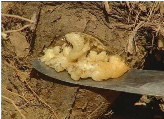
شکل ۱: شیرابه باریجه

جمع‌آوری شد. نمونه‌ای از گیاه تازه در گروه زیست‌شناسی دانشگاه گلستان و مقایسه با نمونه هرباریوم نام علمی آن تأیید گردید و سپس صمغ گیاه در سایه و دور از نور آفتاب طی مدت چهار روز خشک شد.