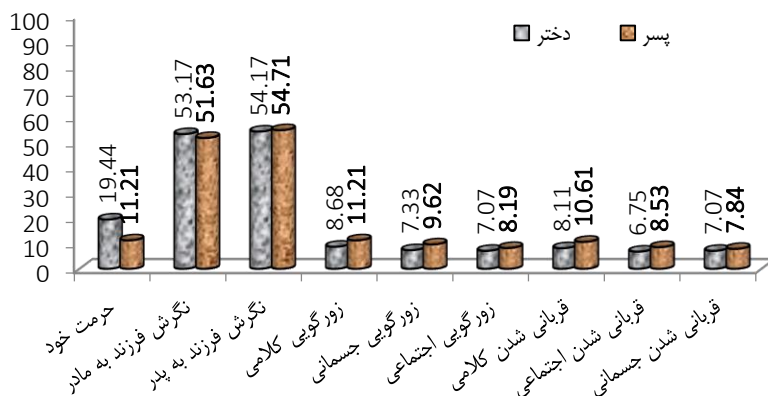
شکل ۱. مقایسه میانگین دختران و پسران در متغیرهای پژوهشی

در نهایت، نتایج در خصوص ابعاد قربانی شدن نشان می‌دهد که پسران در سه بعد کلامی، اجتماعی و جسمانی میانگین بالاتری نسبت به دختران کسب نموده‌اند. در کل نمونه، قربانی شدن کلامی و اجتماعی به ترتیب بیشترین و کمترین میانگین را دارا هستند (۹/۳۶ در برابر ۷/۴۶). مقایسه میانگین گروه دختران و پسران در متغیرهای پژوهشی در شکل ۱ و مقایسه میانگین ابعاد زورگویی و قربانی شدن در کل نمونه در شکل ۲ آورده شده است.