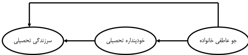
شکل ۱: مدل مفهومی پژوهش

با توجه به آنچه بیان شد، و با توجه به ارتباط نظری و پژوهشی متغیرها و همچنین کمبود تحقیقات صورت گرفته در این زمینه، بررسی رابطه جو عاطفی خانواده با سرزندگی تحصیلی از طریق خودپنداره تحصیلی در خور بررسی است. بنابراین، پژوهش حاضر در پی بررسی این فرضیه است: خودپنداره تحصیلی نقش واسطه‌ای در ارتباط میان جو عاطفی خانواده و سرزندگی تحصیلی دارد. مدل مفهومی پژوهش نیز در شکل ۱ آورده شده است.