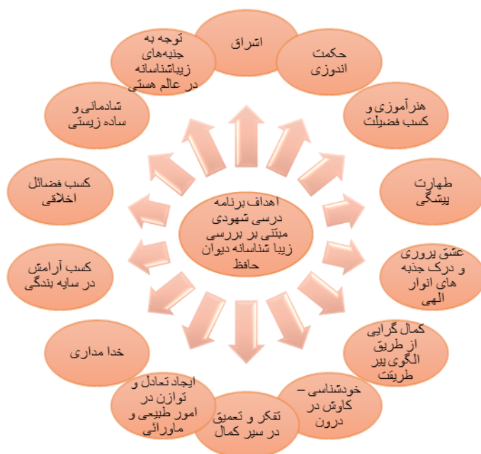
شکل ۳. مقوله محوری راهبردهای یادگیری - یاددهی برنامه درسی شهودی مبتنی بر بررسی زیباشناسانه دیوان حافظ