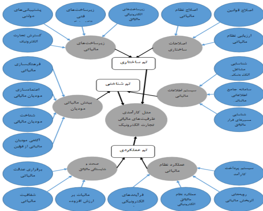
نمودار (۱): مدل مفهومی پژوهش بر حسب شبکه مضامین مستخرج از مصاحبه‌ها

توجه به موارد فوق، مدل کارآمد ظرفیت‌های مالیاتی تجارت الکترونیک به صورت نمودار ۱ ارائه شده است.