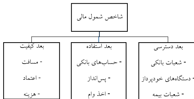
نمودار ۲. شمول مالی و ابعاد و شاخص‌های آن

منظور از «دسترسی» به خدمات مالی، ویژگی‌هایی چون نزدیک بودن، در دسترس بودن و سهولت (آسان‌یابی) است. منظور از «استفاده» (شمول مالی)، قابلیت‌ها و استعداد‌های مالی و کاربردهای واقعی (شامل میزان و دفعات کاربرد، نظم‌پذیری و قاعده‌مندی) است و «کیفیت» خدمات مالی نیز بر سازگاری با نیازهای مشتریان و استمرار و مسئولیت‌پذیری خدمات دلالت می‌کند. ابعاد شمول مالی در نمودار (۲) ترسیم شده است.