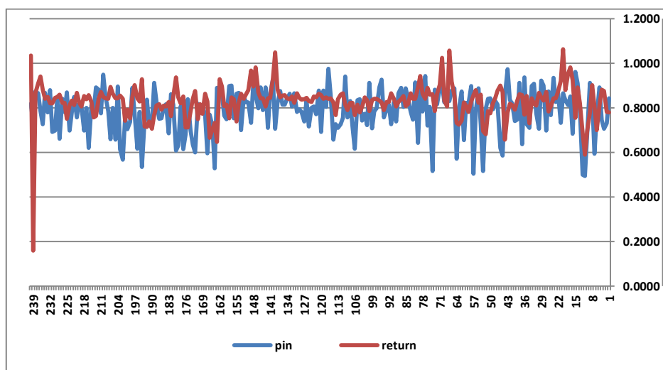
مأخذ: یافته‌های پژوهشگر

همچنین سال جدید و عدم وجود ارائه گزارشی در رابطه با عملکرد شرکت‌ها برای سال جدید دانست. میانگین نرخ رشد حجم معاملات ۰/۰۰۵۰ است. بیشترین مقدار ۲/۱۵۸۶ و کمترین مقدار ۲/۲۷۸۶- است. مقداری اختلاف بین میانگین و میانه وجود دارد که نشان‌دهنده این است که توزیع تا حدودی نرمال نیست و دارای چولگی مثبت و کشیدگی مثبت است. بازده سهام دارای میانگین ۰/۰۰۰۹- است. بیشترین مقدار بازده ۰/۰۱۸۵ و کمترین مقدار آن ۰/۰۵۶۷- است. بین میانه و میانگین هم توزیع نرمال است؛ چون مقادیر به هم نزدیک، دارای پراکندگی حول میانگین ۰/۰۰۰۰۶ و دارای چولگی منفی و کشیدگی مثبت است. مقایسه روند حرکتی احتمال معاملات آگاهانه (PIN) و بازده سهام به صورت زیر است: