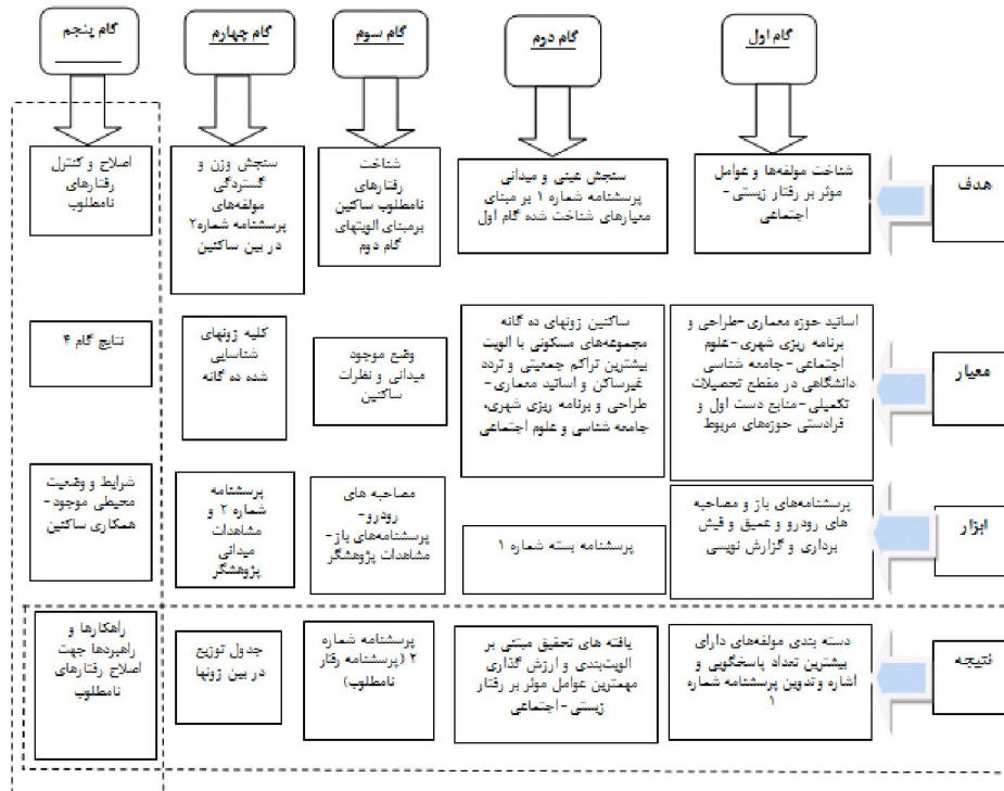
شکل شماره ۱. فرآیند انجام پژوهش.