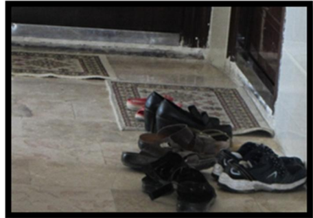
تصویر شماره ۷. کد رفتاری F. مأخذ: نگارندگان تصویر شماره ۸. کد رفتاری H. مأخذ: نگارندگان