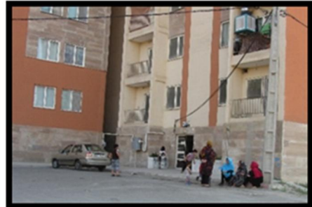
تصویر شماره ۳. کد رفتاری A. مأخذ: نگارندگان تصویر شماره ۴. کد رفتاری B. مأخذ: نگارندگان