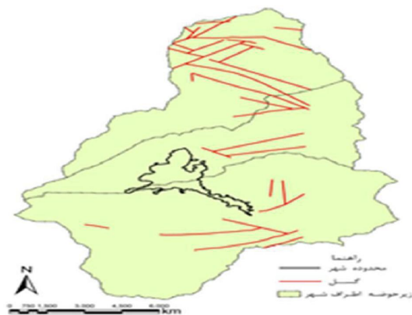
شکل ۳- زمین‌شناسی و گسل‌های حومه شهر توپسرکان

سه گسل اصلی با امتداد شمالی و جنوبی در جنوب شهر همدان در شرق کوه الوند وجود دارند. مهم‌ترین و طولانی‌ترین آنها (تقریباً به طول ۳۵ کیلومتر) از جنوب شهر همدان شروع می‌شود، به طرف جنوب تا کوه سنگ سفید در شرق شهر توپسرکان ادامه می‌یابد، سپس به گسل‌های فرعی کوه چشم دره در جنوب شهر توپسرکان می‌پیوندد. این گسل به نام کشین - علی آباد دمق معروف است.