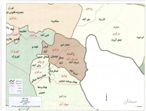
نقشه (۱): موقعیت نسبی شهرستان پاکدشت