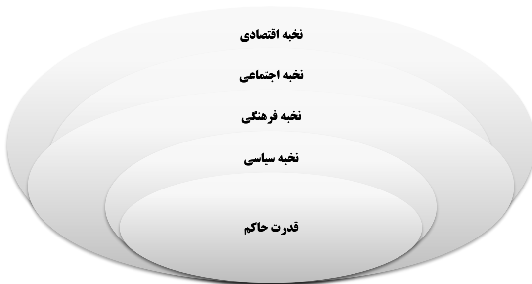
(شکل ۱-۱) ساختار «هم‌مرکز» رابطه گروه‌های نخبه و حکومت در کشورهای جهان سوم

به عبارتی بر خلاف «جوامع صنعتی مدرن»، کشورهای جهان سوم فاقد «مرکز حیاتی» (برآمده از تحولات تدریجی اقتصادی، سیاسی و اجتماعی در طبقه متوسط) هستند که بستر ضروری برای شکل‌گیری «نخبه» به گونه مستقل است. در این کشورها نخبگان در حیطه‌های مختلف سیاسی، اجتماعی، فرهنگی، اقتصادی و... هم‌مرکزند و هم‌محور؛ به این معنا که حیات و موقعیت خود را مدیون شخص حاکم، حزب حاکم یا طبقه حاکم می‌دانند و