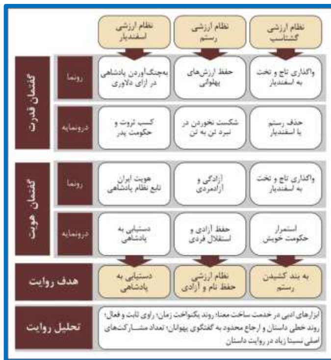
شکل ۲- نظام گفتمانی غالب در داستان رستم و اسفندیار