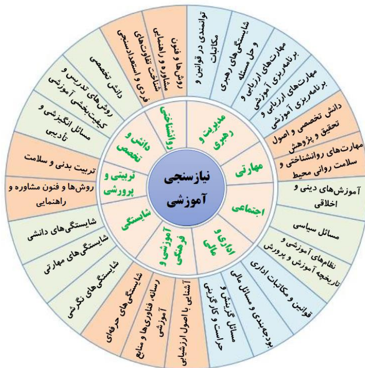
شکل ۳- الگوی پیشنهادی برای نیازسنجی

این الگو که بر اساس تحلیل کیفی و فراوانی موضوعات مختلف طراحی شده است، به‌عنوان یک راهکار جامع و اثربخش برای ارتقای کیفیت آموزش ضمن خدمت فرهنگیان معرفی می‌شود. هدف از این الگو بهبود عملکرد آموزشی و افزایش رضایت شغلی فرهنگیان است. با توجه به تمرکز آن بر یادگیری مؤثر و تغییر رفتار فرهنگیان، این مدل می‌تواند به‌عنوان ابزاری کارآمد در جهت توسعه مهارت‌های تدریس، مدیریت کلاس و تعاملات حرفه‌ای فرهنگیان عمل کند و به شکل‌گیری محیط‌های آموزشی با کیفیت بالا منجر شود.