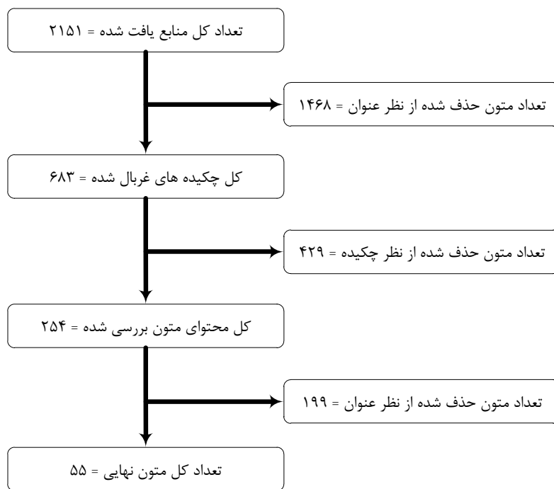
شکل ۲: چارت روند نما برای انتخاب آثار مناسب برای تحلیل

روش فراترکیب و ارائه الگوی ارتباط با مشتری مبتنی بر نقاط تماس در سفر مشتری انتخاب شدند. مرحله چهارم: استخراج اطلاعات از متون و مقالات در این مرحله با مطالعه و بررسی دقیق منابع نهایی شده و مطابق با اهداف و سوال‌های پژوهش یافته‌های مرتبط از هر کدام از منابع شامل مولفه‌ها و شاخص‌های ارتباط با مشتری مبتنی بر نقاط تماس در سفر مشتری استخراج شد که در جدول ۴ قابل مشاهده می باشد.