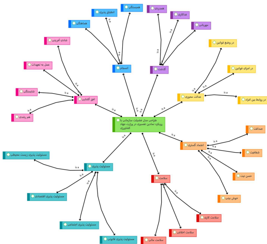
شکل ۴. طراحی و تبیین طراحی مدل فضیلت سازمانی با رویکرد کیفی در وزارت جهاد کشاورزی کنترل کیفیت تحلیل کیفی انجام شده (خروجی اطلس تی)

بر اساس جدول فوق، الگوی تحقیق مشتمل بر ۱ مضمون فراگیر و ۷ مضمون سازمان دهنده و ۲۴ مضمون پایه‌ای بوده است. در نهایت براساس مقوله‌های نهایی، مدل پژوهش ارائه شده است: