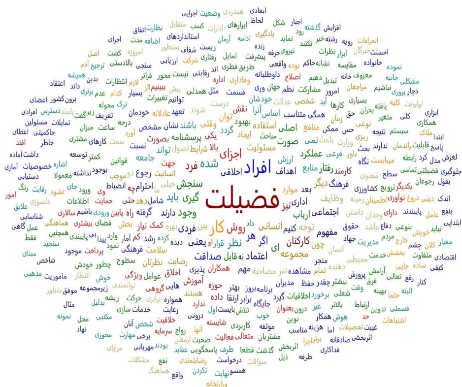
شکل ۲. ابر کدها

کدگذاری‌ها به صورت نرم‌افزاری، انجام شد. در این مرحله، ۹۳ کد اولیه از متون و مقالات احصاء شد. مفاهیم اولیه‌ای که از تحلیل مضمون و بررسی ادبیات پژوهش، طراحی و تبیین طراحی مدل فضیلت سازمانی با رویکرد کیفی در وزارت جهاد کشاورزی و مقالات و کتب حاصل شده، در این مرحله ارائه شده است. شاخص‌های شناسایی شده، همان گزاره‌های کلامی هستند که از پاسخ به سؤالات به دست آمده و بعد از استخراج کلیه این گزاره‌های کلامی، برخی دارای اشتراک بودند که بر اساس ادبیات و مبانی نظری موجود، دسته‌بندی شدند و بر اساس آن مفاهیم ثانویه، شکل گرفتند.