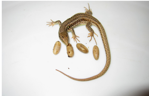
شکل ۸- Iranolacerta brandtii brandtii