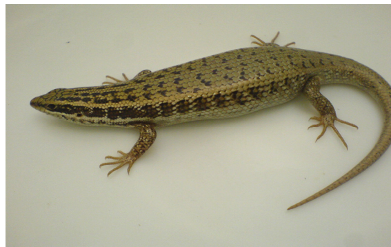
شکل ۱۲- Trachylepis aurata transcaucasica