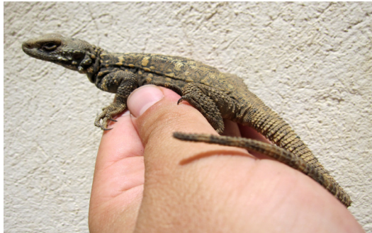
شکل ۲- Laudakia caucasica caucasica

aurata transcaucasica اسکینک علفزار طلایی (شکل ۱۲)، و bivittatus Ablepharus اسکینک علفزار جنوبی (شکل ۱۳)، و از خانواده Anguidae تنها یک گونه، با نام لوس مار یا مارمولک شیشه‌ای