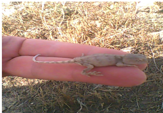
شکل ۳- Phrynocephalus persicus