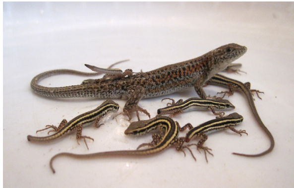
شکل ۱۱- Ophisops elegans