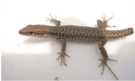
شکل ۵- Darevskia chlorogaster