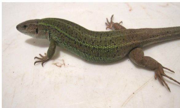
شکل ۱۰- lacerta strigata