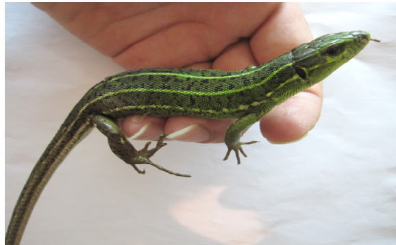
شکل ۹- Lacerta media media