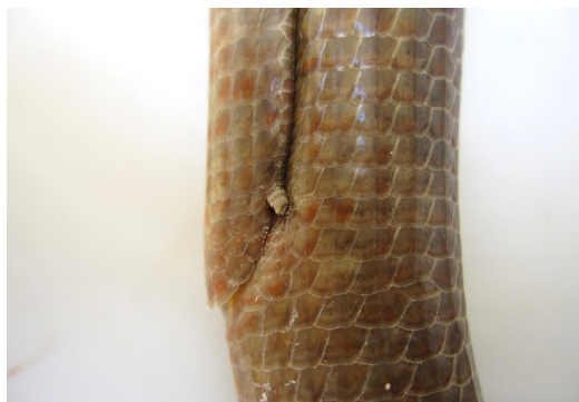
شکل ۱۶- آثاری از اندام حرکتی و چین عمیق یا شیار در پهلوی لوس مار