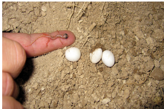
شکل ۱۵- تخم‌ها و جنین آگامای قفقازی در لانه‌ای زیر تخته سنگ