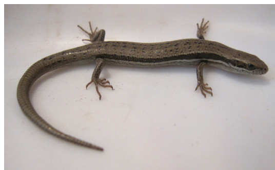
شکل ۱۳- Ablepharus bivittatus