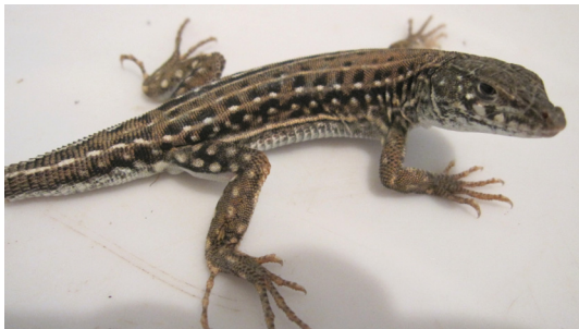
شکل ۷- Eremias strauchi strauchi