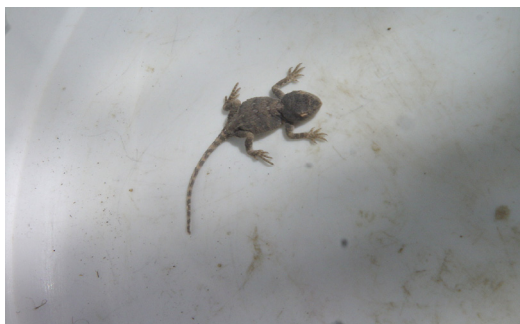
شکل ۴- Trapelus ruderatus ruderatus