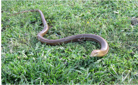
شکل ۱۴- Pseudopus apodus apodus