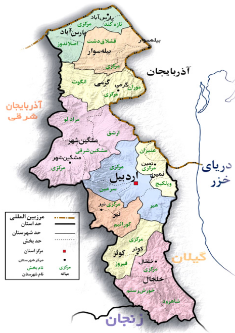
شکل ۱- موقعیت جغرافیایی استان اردبیل

دیگری تپ اروپا-سیبری (آپی) که پوشش گیاهی است [ ۷، ۸ و ۹]. حالت تجمعی دارد و پوشش آن تقریباً صد درصد