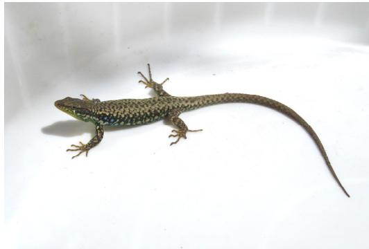
شکل ۶- Darevskia raddei raddei