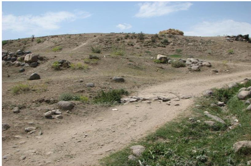
تصویر ۱. نمای کلی محوطه خرمین یثری.