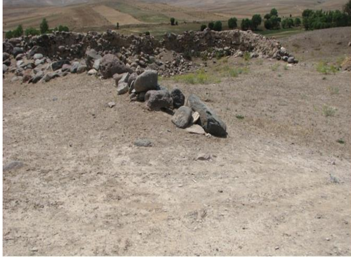
تصویر ۲. نمای سطحی از محوطه خرمن یثری و سنگ‌های اطراف آن