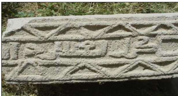
۴- حجاری روی سنگ با نقش هندسی مثلثی و کتیبه