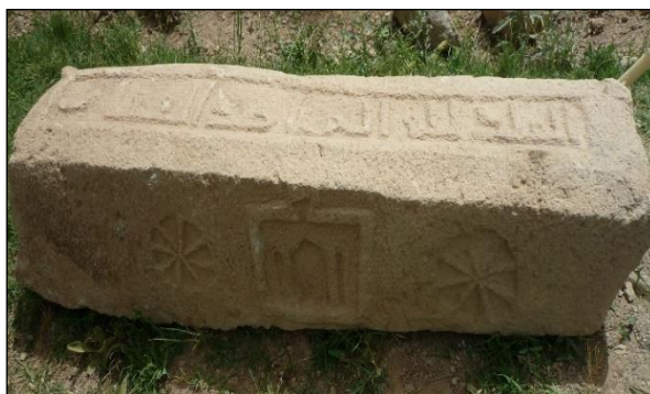
شکل ۱۱- سنگ چهاروجهی حجاری شده با نقوش آیات قرانی، خورشید و محراب یافت شده در کنار مغاره بزرگ خلیفه کنده