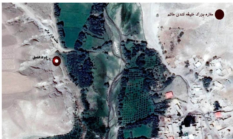
۳- موقعیت مکانی مغاره بزرگ یا بازار یولی به روستای خلیفه کندی حاتم