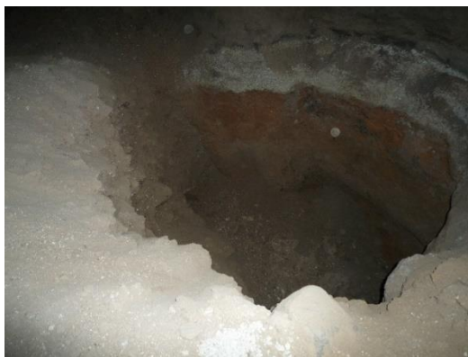
شکل ۸- حفاری غیر مجاز در وسط مغاره ی بزرگ روستای خلیفه کنده