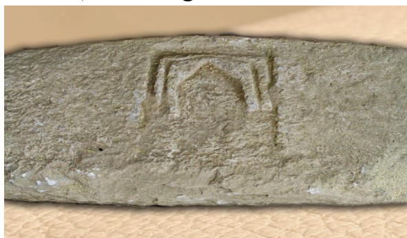
شکل ۱۰- سنگ حجاری شده با نقوش محراب