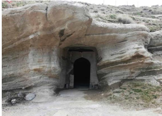
شکل ۱۳- تصویری از نمای ورودی معبد قدمگاه روستای بادامیار