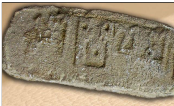
شکل ۶- سنگ حجاری شده با نقوش زنجیره ی و خط کوفی