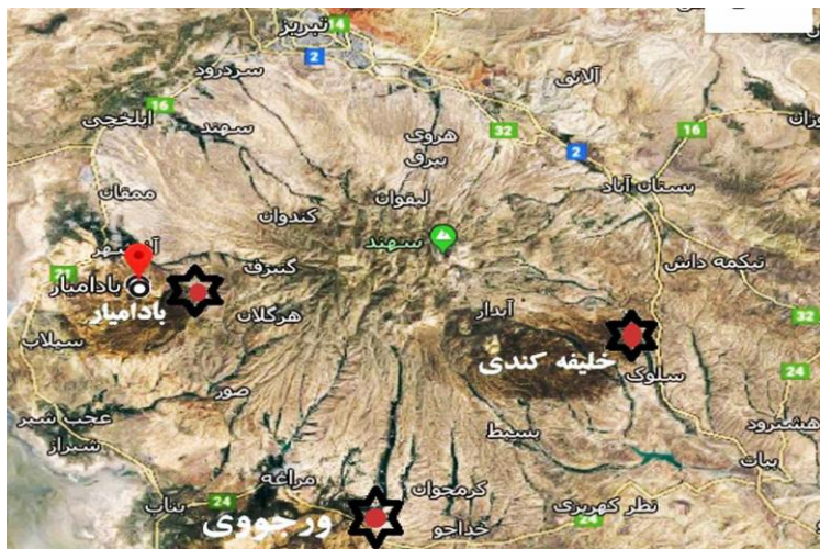
شکل ۱- موقعیت جغرافیایی مغاره های سه گانه نسبت به رشته کوه سهند