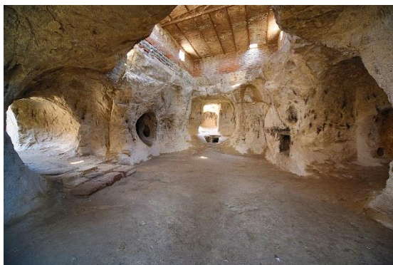
شکل ۱۵- تصویری از درون معبد ورجووی مراغه