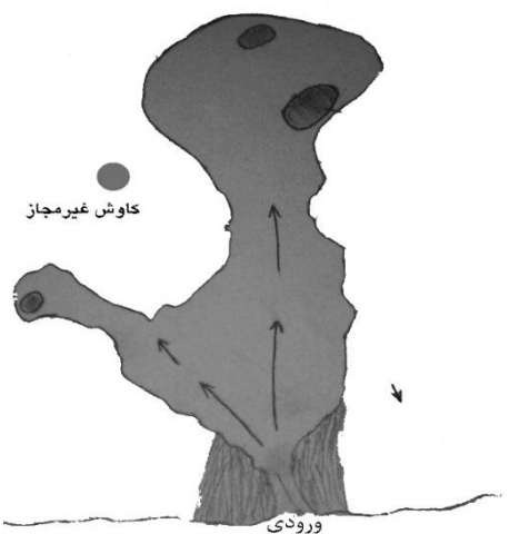
شکل ۹- نقشه شماتیک از درون مغاره ؛ طرح از مهندس بهرام اکبری (سال ۱۳۹۴)