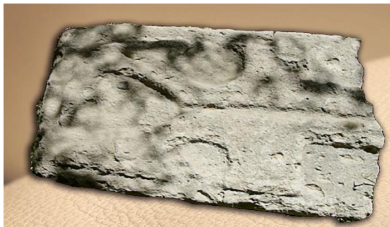
شکل ۵- نقش دسته خنجر بر روی سنگ حجاری شده