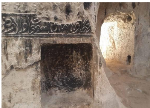
شکل ۱۷- تصویری از حجاری دورن معبد ورجووی با موضوع سوره قرآنی با خط عربی ، در تالار مرکزی مغاره ی ورجووی