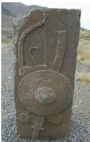
شکل ۱۶- سنگ حجاری شده با نقوش ادوات نظامی