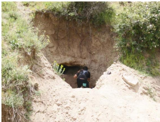
شکل ۷- ورودی مغاره خلیفه کندی و آثار حفاری غیر مجاز