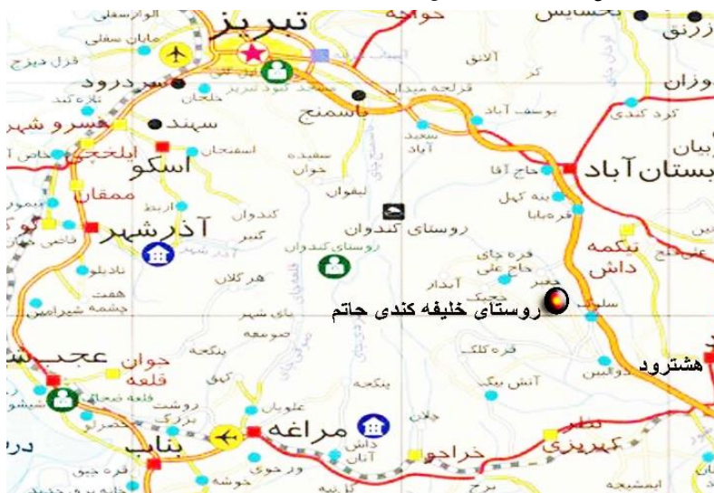
شکل ۲- موقعیت جغرافیایی خلیفه کندی نسبت به شهرهای اطراف و منطقه سهند