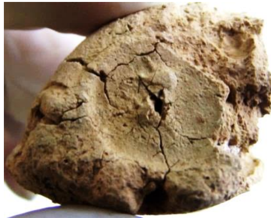
تصویر ۱ (گوی ۱۲ من)