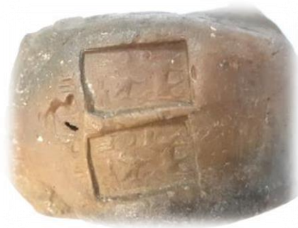
تصویر ۴ (گوی ش ۶)