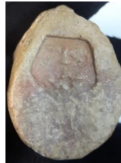
تصویر ۳ (گوی ۱۱)