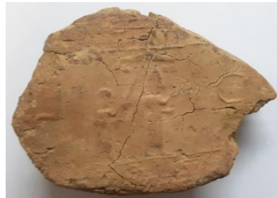
Seidl, 1988: 146, B 2 (شکل ۲)