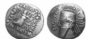
سکه نقره درهم وُنن اول (۸-۱۲ م.) S 60.5, Mint Ecbatana