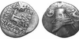
سکه نقره درهم فرهاد چهارم (۲۸-۲ پ.م.) S 54.7, Mint Ecbatana