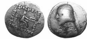
سکه نقره درهم شاه ناشناس دوم (۸۰-۷۰ پ.م.) S 30.15, Mint Ecbatana