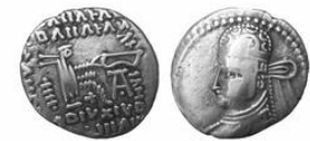
سکه نقره درهم پارتاماسیات (۱۱۶ م.) S 81.1, Mint Ecbatana