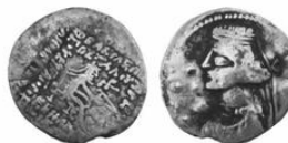
سکه نقره درهم مهرداد سوم (۵۷-۵۴ پ.م.) S 41.7, Mint Rhagae