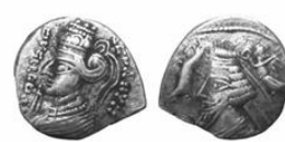
سکه نقره درهم فرهادک و ملکه موزا (۲ پ.م.-۴ م.) S 58.10, Mint Rhagae