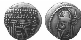
سکه نقره درهم بلاش ششم (۲۰۸-۲۲۸ م.)