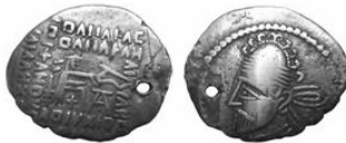
سکه نقره درهم پاکر دوم (۷۸-۱۰۵ م.) S 77.8, Mint Ecbatana