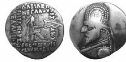
سکه نقره درهم آزد اول (۹۰-۸۰ پ.م.) S 31.5, Mint Ecbatana