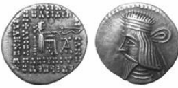
سکه نقره درهم اردوان دوم (۱۰-۲۸ م.) S 61.7, Mint Ecbatana