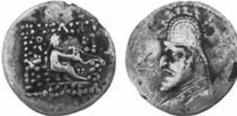
سکه نقره درهم گودرز اول (۹۵-۹۰ پ.م.) S 33.7, Mint Margiane