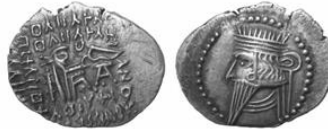
سکه نقره درهم بلاش سوم (۱۰۵-۱۴۷ م.) S 78.10, Mint Ecbatana