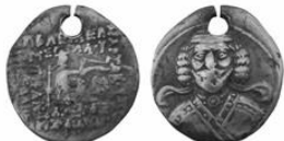
سکه نقره درهم داریوش؟ (۷۰ پ.م.) S 35.4, Mint Mithradatkart