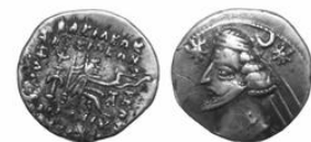
سکه نقره درهم آزد دوم (۵۷-۳۸ پ.م.) S 48.8, Mint Ecbatana