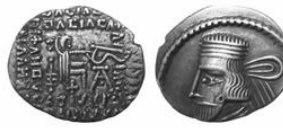
سکه نقره درهم وردان دوم (۵۵-۵۸ م.) S 69.14, Mint Ecbatana