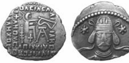
سکه نقره درهم وُنن دوم (۵۱ م.) S 67.1, Mint Ecbatana