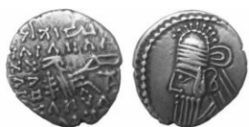
سکه نقره درهم بلاش چهارم (۱۴۷-۱۹۱ م.)