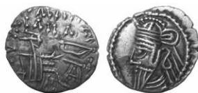
سکه نقره درهم خسرو دوم (۱۹۰ م.)