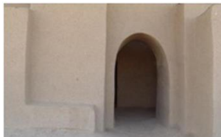
تصویر ۴. یک در داخلی با تاق هلالی در نوشیجان http://www.negah.trib.ir