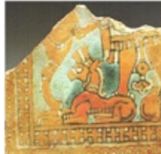
تصویر ۷. تکه‌ای از آجر لعابدار رنگی در میان خرابه‌های معبد آکروپل شوش، (محمدپناه، بهنام، ۱۳۸۶ ص ۴۲)