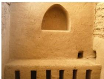
تصویر ۳. یک تاقچه تزئینی با طاق هلالی در نوشیجان http://www.negah.trib.ir