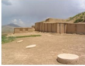
تصویر ۵. پایه ستون در زیویه