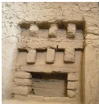
تصویر ۱. یک نیش تزئینی (پنجره کور) در نوشیجان http://www.negah.trib.ir