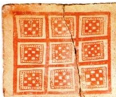
تصویر ۲. کاشی رسی از باباجان لرستان، کرتیس، جان، ۱۳۷۸ (تصویر ۳۷)