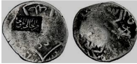
تصویر شماره ۱- سکه سور شارژ (شعار من التجا الی الحق نجا) شاه اسماعیل بر روی سکه ترکمانان آق قویونلو،