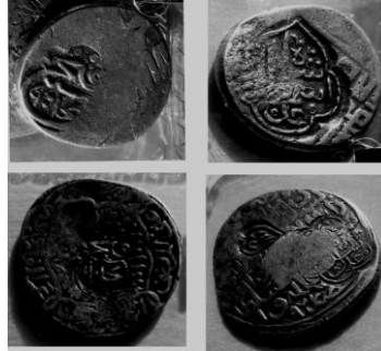
تصویر شماره ۲- ضرب مجدد نام عدل شاه اسماعیل روی سکه ترکمانان آق قویونلو، پشت سکه ضرب فتح ۹۰۴ه.ق، عکس از