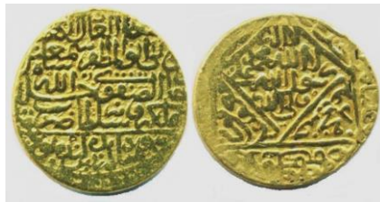
تصویر شماره ۳- سکه اشرفی شاه اسماعیل ضرب تبریز (۹۱۵-۹۱۹ه.ق پاک شده)