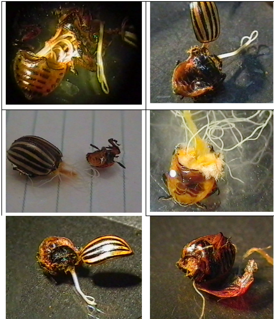
شکل ۲- تصاویری از نمونه‌های سوسک‌های برگ‌خوار سیب‌زمینی آلوده به نماتد بیماری‌زای Hexameris sp.