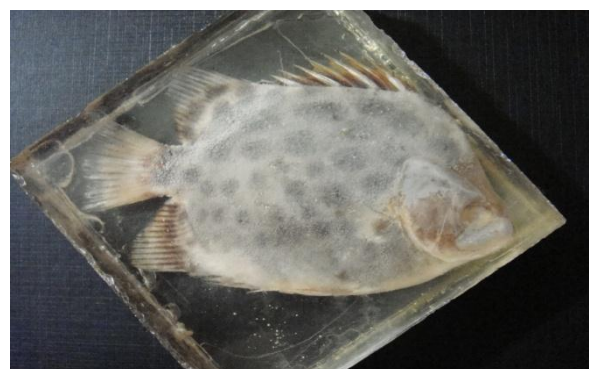
شکل ۳: زروک ماهی با هاله ای کدر رنگ در اطراف بدن

نتایج حاصل از استفاده از نمونه های تثبیت شده در فرمالین (گروه ۲): در این روش ابتدا ماهی مورد نظر به مدت یک هفته در فرمالین ۵ درصد تثبیت گردید و سپس نمونه از فرمالین خارج و بوسیله آب شستشو شد تا خونابه و ترشحات زرد رنگ آن جدا گردد. در این مرحله آب موجود در سطح نمونه وسیله روزنامه خشک می شود سپس طبق روش بالا با اضافه کردن رزین در سه مرحله آنرا بوسیله رزین تثبیت می نمایم. نتایج حاصل از روش فوق در جدول شماره ۶ آمده است. همان طور که از شکل ۳ معلوم است پس از مدتی آب موجود در بدن ماهی به سطح پوست آمده و موجب تشکیل هاله کدر رنگی بر سطح پوست می گردد که باعث از بین رفتن شفافیت در نمونه شده.