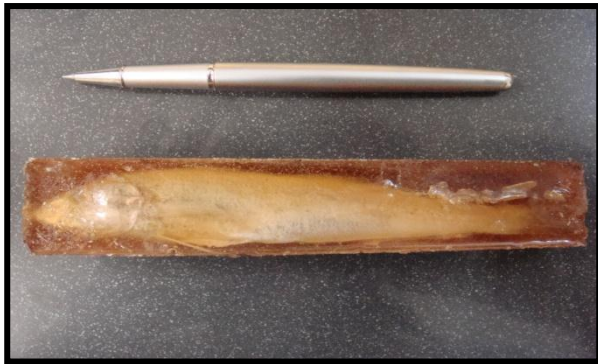
شکل ۲: ماهی شورت و تغییر رنگ در رزین در اثر فساد در نمونه

قرار گرفت که نتایج حاصل از روش فوق در جدول شماره ۵ آمده است این روش فقط در مورد ماهیان کوچک و ریز می تواند کاربرد داشته باشد و در مورد سایر ماهیان در اثر فساد رنگ رزین و ماهی تغییر می کند شکل ۲.