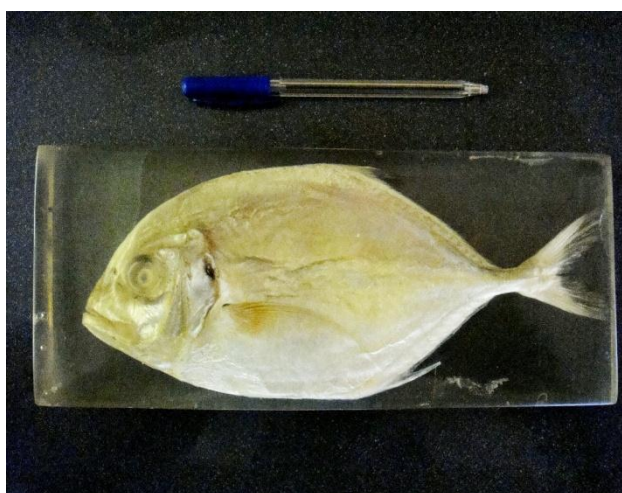
شکل ۴: ماهی مقوا

نتایج حاصل از استفاده از نمونه های آبیگری شده بوسیله استن (گروه ۳): بدین منظور نمونه هایی که در فرمالین تثبیت شده اند پس از شستشو در استن با درجه خلوص کم به زیاد قرار می گیرند زیرا استن یک ماده آبیگری قوی است برای کاهش اثر چروکیدگی ابتدا از استنی با درجه خلوص کم تر استفاده می شود و به ترتیب درجه خلوص آنرا افزایش می دهیم نتایج حاصل از این روش در جدول شماره ۷ آمده است. همانطور که از شکل شماره ۴ مشخص است نمونه تهیه شده با این روش دارای کیفیت بهتر و شفافیت بیشتری می باشد.