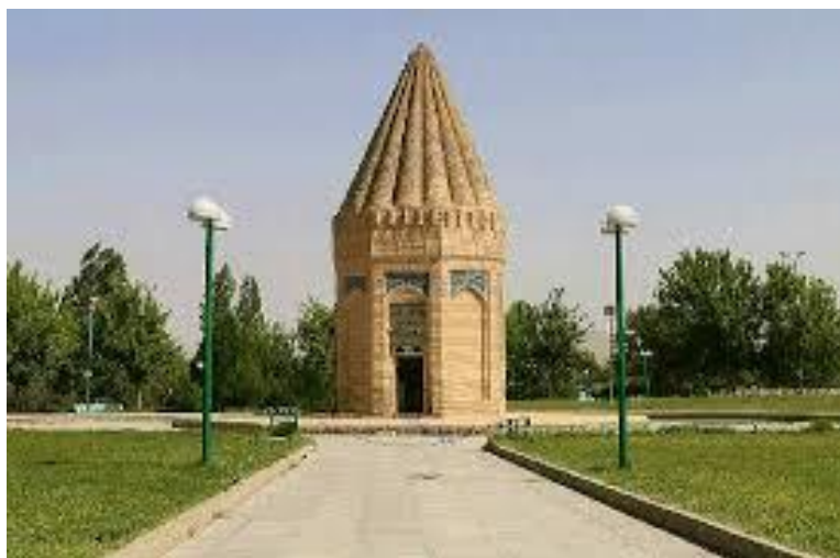
شکل ۵ مقبره حیقوق نبی در توسیرکان