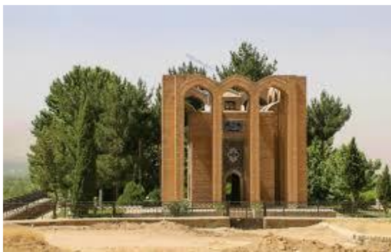
شکل ۶ آرامگاه میر رضی آرتیمانی