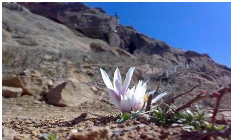
شکل ۳: دامنه‌های شمالی و جنوبی الوند

در دامنه‌های شمالی الوند دره‌های پر آبی مانند: دره برفین، دره گنجانمه، دره عباس آباد، دوزخ دره، دره گوساله، دره کیوارستان، دره سیمین دره، دره مراد بیگ، دره دیوین، دره قز، دره حیدریه و غیره وجود دارد و دره‌های مصفایی نیز در دامنه جنوبی الوند واقع است، از جمله دره سرکان، دره آرتیمانی، دره فاران، دره گزندر، دره شهرستانه و غیره.