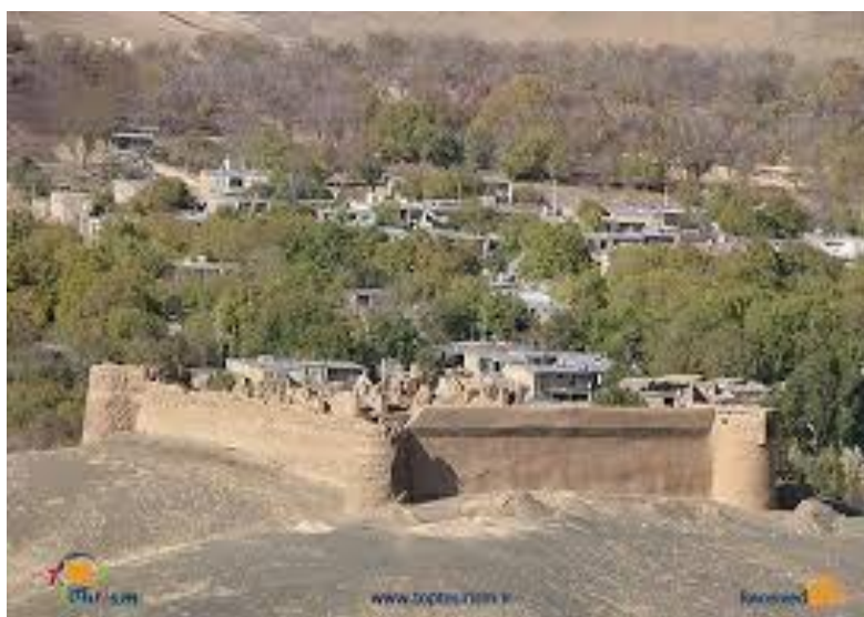
شکل ۴ قلعه اشتران در شهر تویسرکان

از آثار قدیمی دیگر در شهرستان تویسرکان، قلعه‌های قدیمی است. تاکنون ۸ قلعه قدیمی در این شهرستان شناسایی شده است که از بین آنها قلعه اشتران و (اردلان) در سال ۱۳۸۳ به ثبت رسیده است. این قلعه، قلعه‌ای نظامی بوده که در مجاورت روستای اشتران و ۱۸ کیلومتری شهر تویسرکان قرار گرفته است. این قلعه مشرف به قلعه خان گرمز و در مسیر جاده قدیمی همدان - تویسرکان بنا شده است که با وجود گذشت زمان هنوز هم تا حدودی پا برجاست.