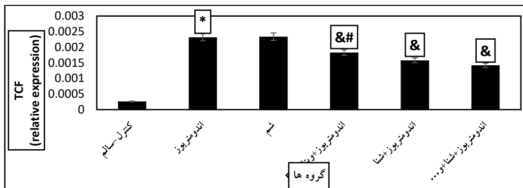
نمودار ۱: بیان ژن TCF برحسب تغییرات GAPDH در گروه‌های مختلف پژوهش.

*: تغییرات معنادار نسبت به گروه کنترل-سالم، &: تغییرات معنادار نسبت به گروه اندومتريوز، #: تغییرات معنادار نسبت به گروه اندومتريوز+شنا+ويتامين D. اختلاف معنی دار در سطح p < 0.05 .