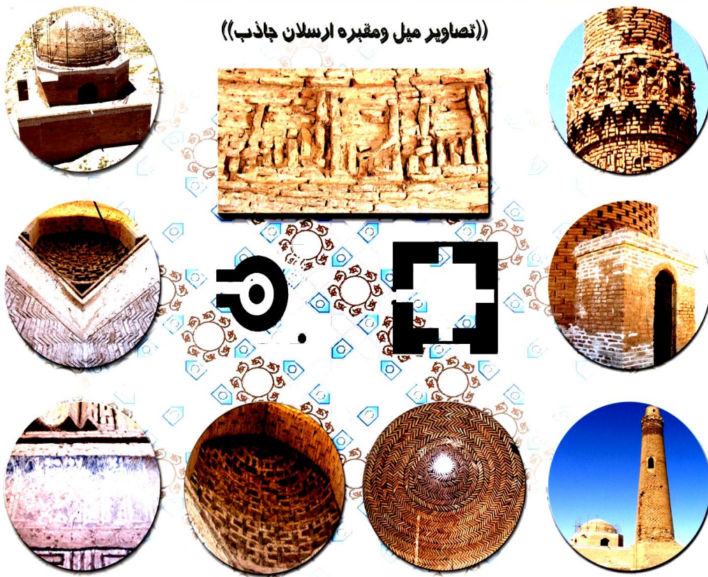
تصویر شماره ۲ و بخش‌هایی از بناهای سنگ بست