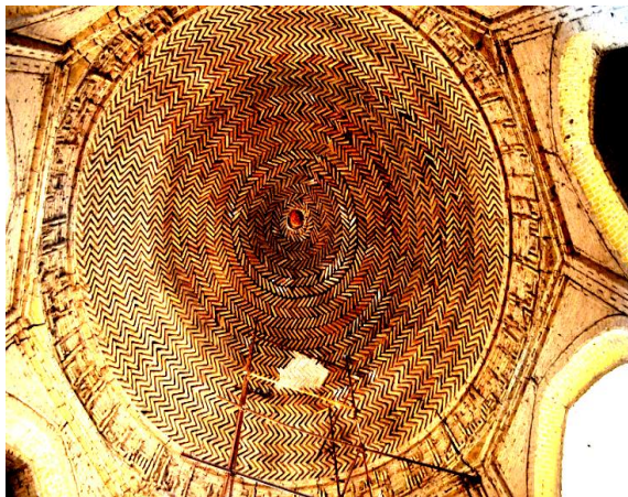
تزیینات داخل گنبد و کتیبه آجری مقبره ارسلان جاذب