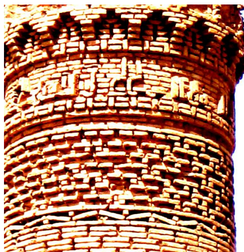
بخشی از تزیینات و کتیبه آجری مناره ایاز