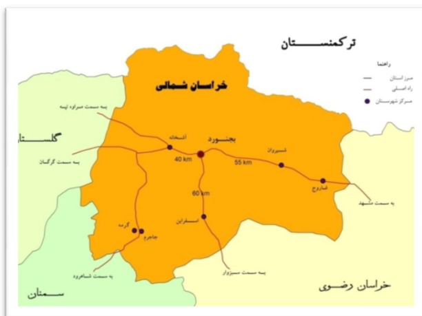
شکل (۱) نقشه

مسکونی قدیم شهر به طور عمدۀ بدون برنامه‌ریزی ایجاد شده و دارای معابر پر پیچ و خم و باریک هستند.