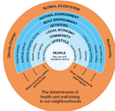
Barton et al., ۲۰۰۴، ملخذ

نمودار شماره ۱ : عوامل محلی موثر بر سلامت در مدل بارتون